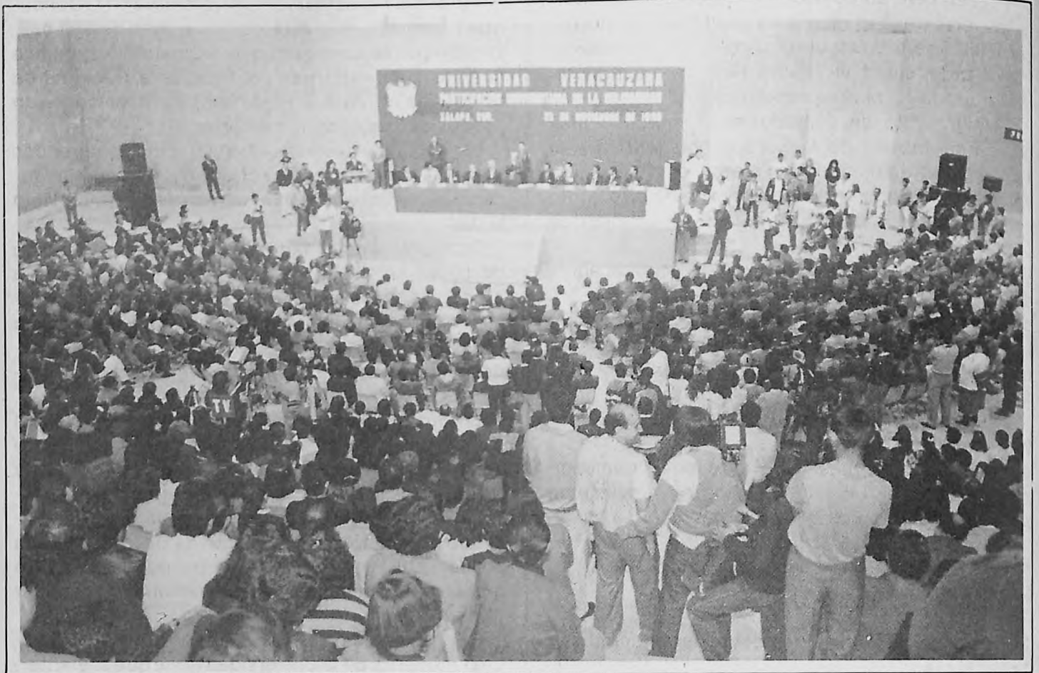
Participación universitaria en la Solidaridad: diálogo con el Presidente de México.

la educación superior depende, en muy alto grado, de su permanente o íntima relación con el estado y con la sociedad en que actúa. Tiene que partir del convencimiento de que una universidad desligada de su entorno corre el riesgo de deslizarse a lo que bien se puede denominar una forma de marginalismo político.