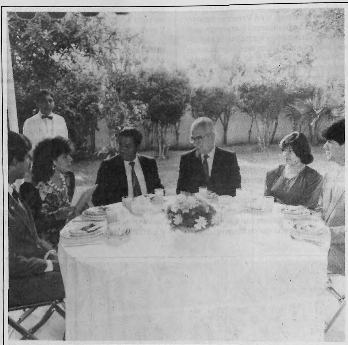
Durante el desayuno en la Casa de Gobierno.

permitirá nunca olvidar a esas gentes. Esa realidad de hacer un esfuerzo, durante toda la vida, por vincularse a esas comunidades.