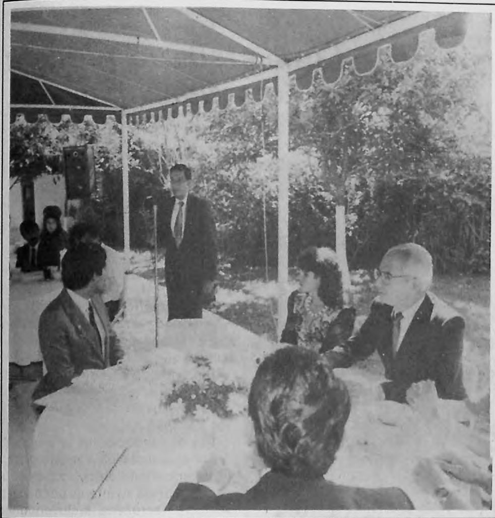
La participación de los pasantes tiene la ilusión y fuerza de todos los jóvenes

presupuesto, con un gobierno Estatal que colabora con su Rector y con sus Autoridades.