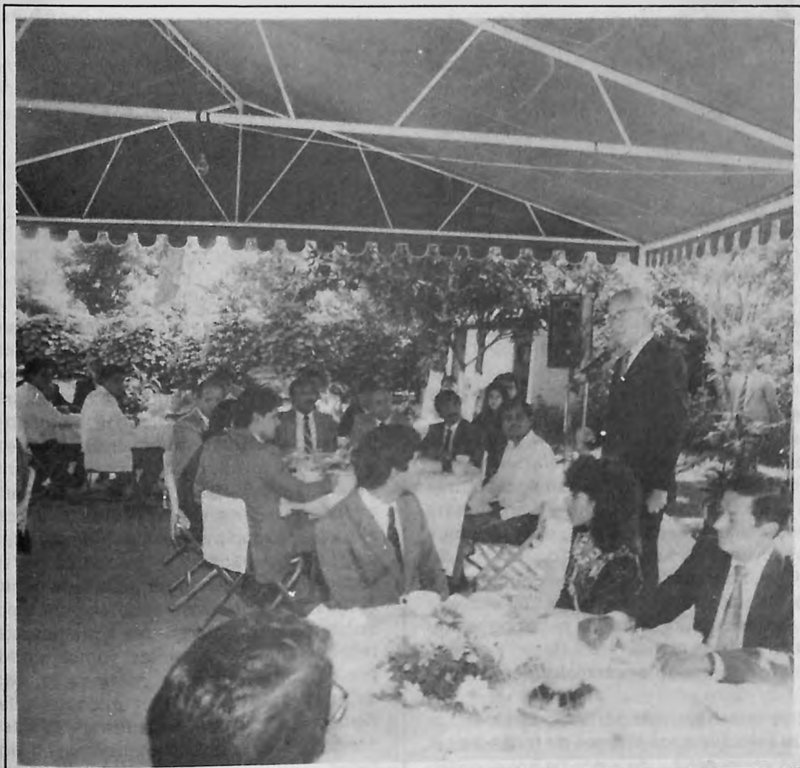
El Gobernador de Veracruz, licenciado Dante Delgado Rannauro durante su mensaje a funcionarios y pasantes universitarios.

Cada uno de ustedes aprenderá que por más esfuerzo que se haga, por más acciones que puedan transformar esa realidad, será un proceso inacabado en el que ustedes tendrán, permanentemente y a lo largo de su vida una semilla sembrada que les