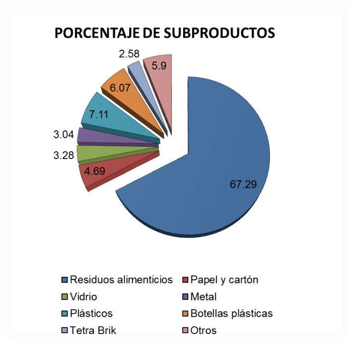
Fig. 3. Gráfica porcentual de los residuos sólidos domiciliarios caracterizados.

En cuanto al manejo de los residuos generados, en tres viviendas realizan acopio de envases plásticos (11.5%) sin fines de lucro; en cinco viviendas se congelan los residuos alimenticios para evitar la proliferación de moscas (19.2%), el resto no realiza ningún tipo de manejo. Cuando el servicio de limpieza pública no pasa regularmente, no se realiza ningún tipo de manejo de la basura, esta se queda almacenada en la vía pública.