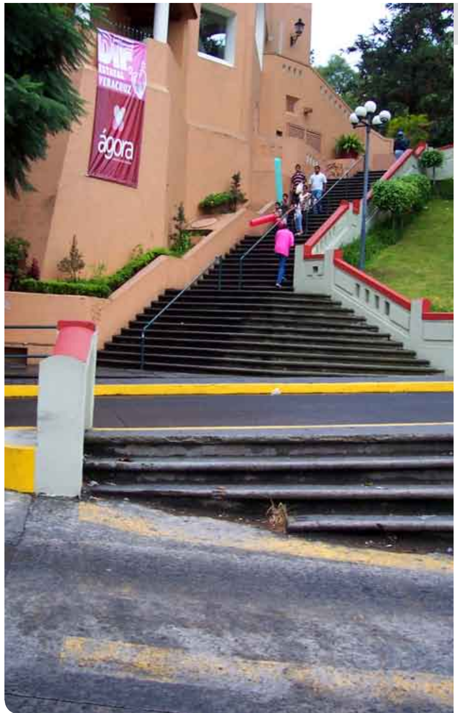
Ilustración 1: Escalinata del Ágora, Parque Juárez. Xalapa, Ver.