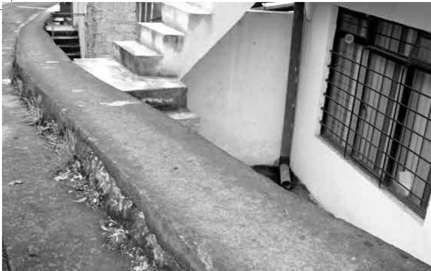
Ilustración 2: Espacio Peatonal limitado. Xalapa, Ver.

El Derecho Urbano es un derecho humano básico, al que hoy son especialmente sensibles en las sociedades urbanas, no solamente los sectores medios (los altos están más protegidos), sino también, y en todos los casos, y con más motivos, los sectores marginados de la sociedad.