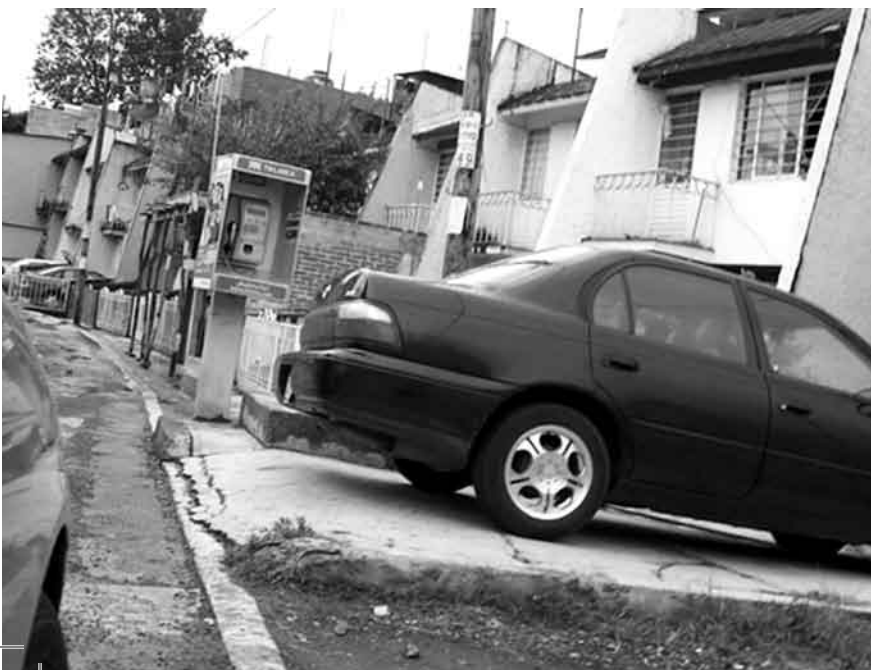
Ilustración 3: Invasión del Espacio Público por el Automóvil. Xalapa, Ver. Foto: Ana Moreno 2008.

recorridos que tiene en la ciudad, sean ser funcionales. Por lo anterior, es de gran importancia conocer las limitaciones físicas y sensoriales de esta población; así como las características espaciales, los bienes, los ambientes que se necesitan para poder traducirlas, en elementos y mobiliario urbano, que trascenderá en beneficio a la sociedad procurando a sus individuos; mayor independencia, reducción de accidentes y, consecuentemente, la disminución de costos de servicios de salud y pérdida de tiempo que redundan en la producción.