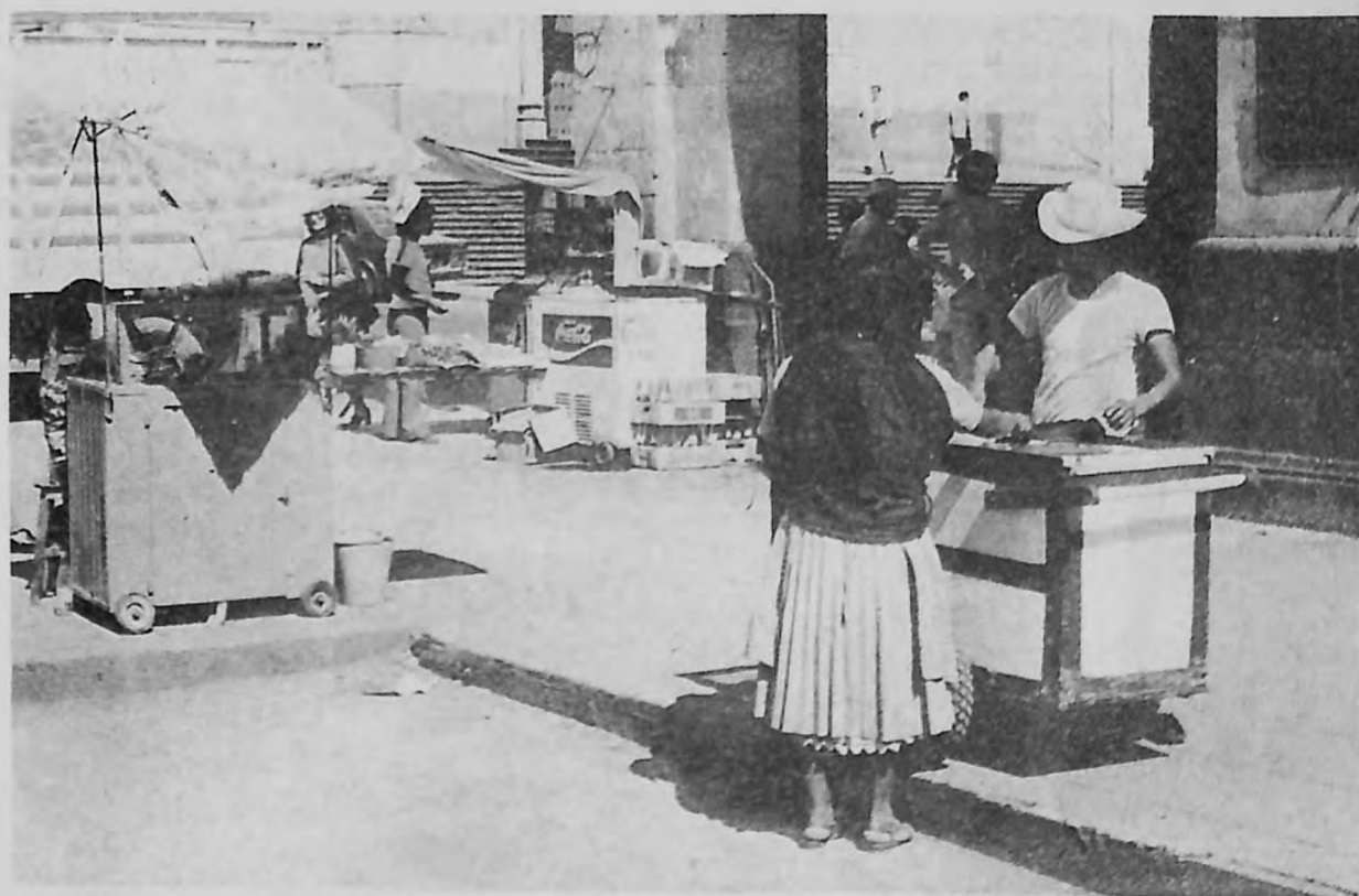
La venta de alimentos al aire libre es fuente de infecciones.

De infección intestinal mueren en México anualmente 60 mil niños (4) y se ha convertido en la primera causa de morbilidad (proporción de enfermos) infantil en el país. En 1978 murieron