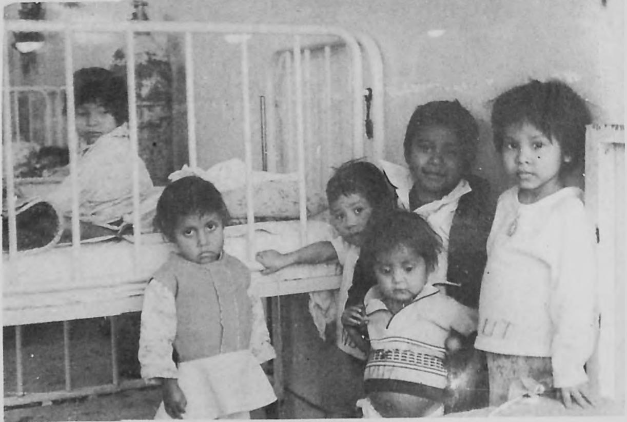
Niños en la sala de nutrición del Hospital Civil de Xalapa.

El 98 por ciento de los internos sufre desnutrición y deshidratación ocasionadas por parásito y diarreas. Estos niños permanecen inmóviles en el hospital, con un voluminoso vientre que contrasta con sus débiles extremidades, sobre las que es dudoso puedan sostenerse en pie. Cuando después de varios días o semanas de alimentación y tratamiento adquieren cierta fuerza física, se sientan en su cuna y lloran continuamente de hambre: "pero no se les puede estar dando comida a cada momento..." (7), explican los médicos residentes, "pues les al-