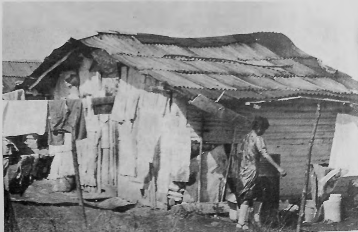
La carencia de agua impide el aseo más elemental.