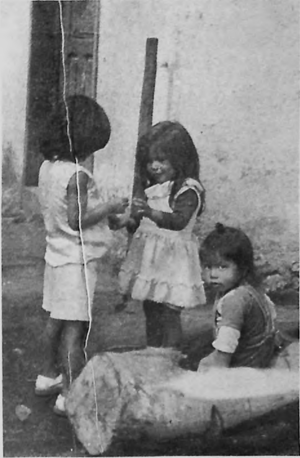
Del suelo los niños recogen gérmenes parasitarios.

gastritis. Este mal es provocado por la secreción inadecuada de jugos gástricos, especialmente el ácido clorhídrico y las enzimas que queman la mucosa y luego la pared intestinal.