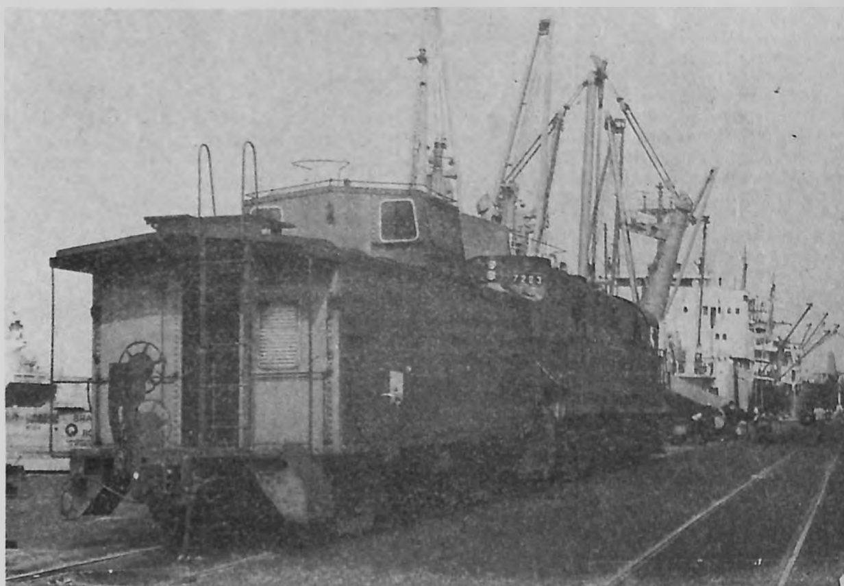
Servicio ferroviario en el sistema de movilización interna.