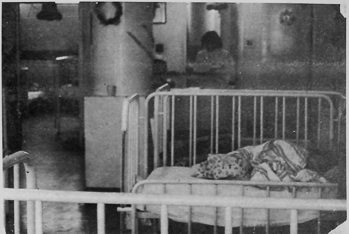
Escena en la sala de nutrición. Hospital "Luis F. Nachón".

La susceptibilidad a la amibiasis es general en niños, adultos, mujeres y hombres. Los síntomas en la mayoría de los casos son imperceptibles y casi siempre se descubre en su fase aguda. El diagnóstico preciso sólo puede obtenerse mediante pruebas de laboratorio a fin de descartar otras infecciones con las que puede confundirse: shigelosis, apendicitis, hepatitis y